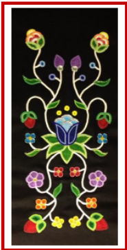
Ojibwe Decorative Beading

Personal initiative and creative self-expression are emphasized in this program. For each fibre art project participants will design, create, construct their project, and be introduced to the history, cultural context, traditions, practices, & applications of these fibre arts. Materials & tools provided for each project.